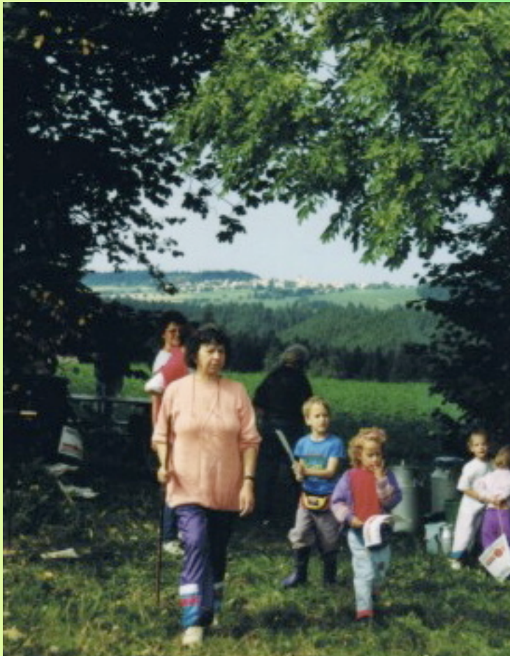
Marche de 1993 Pourtour de la commune - ici à Montcenez -